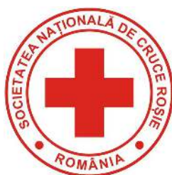
Товариство Червоного Хреста Румунії