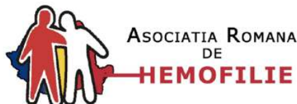
Асоціація гемофілії Румунії