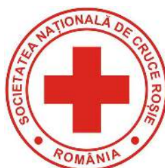
Crucea Roșie România